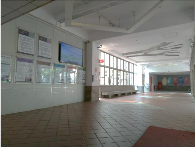
從會議室方向看全景